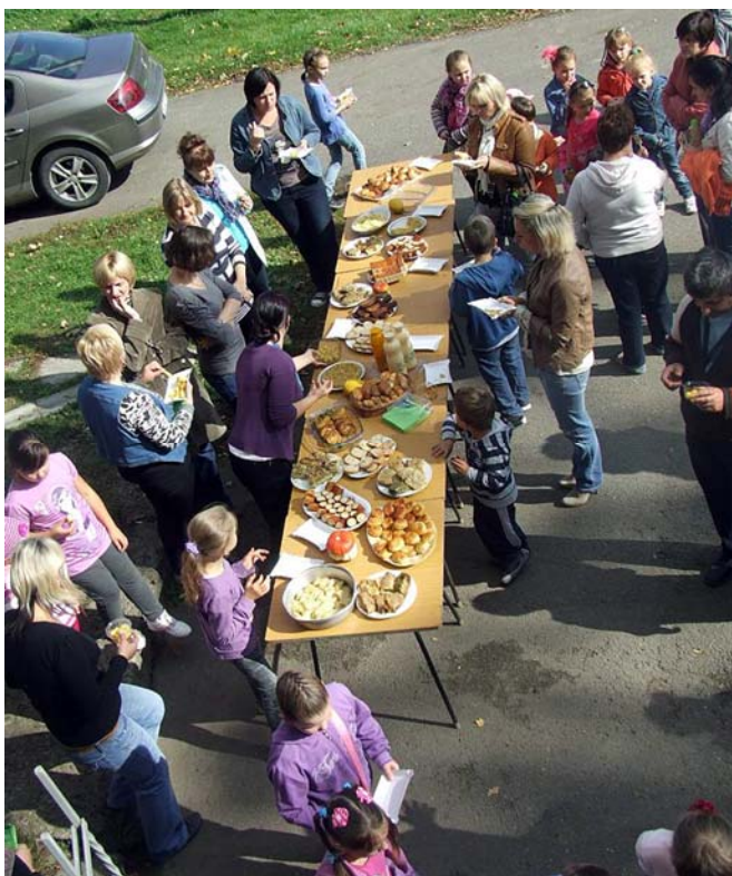
Degustacja ziemniaczanych potraw

SP Chłopice „Dzień Ziemniaka” 5 października 2012 r.