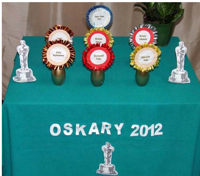
„Fantazje Małych Rąk”