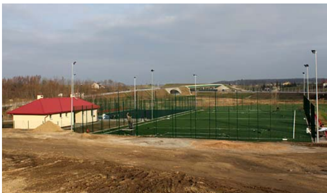
Kompleks boisk Orlik 2012 w Boratynie - w trakcie budowy, październik 2012