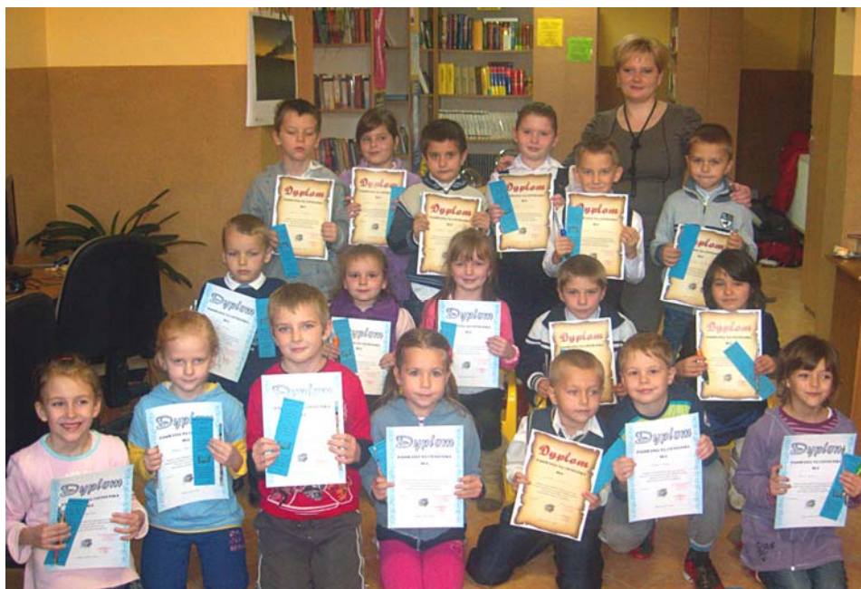
Nowi Czytelnicy Biblioteki w Chłopicach