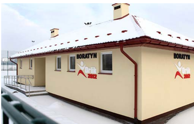
Budynek sanitarno-szatniowy - Orlik 2012 w Boratynie

W miesiącu lipcu został rozpoczęty pierwszy etap prac przy remoncie świetlicy wiejskiej w miejscowości Jankowice. W tym roku w ramach rozstrzygniętego przetargu zostały wykonane następujące prace: wymiana stolarki okiennej, docieplenie budynku wraz z wykonaniem elewacji frontowej, brama garażowa dla potrzeb OSP, wymiana drzwi ewakuacyjnych, płyta odbojowa wraz z chodnikiem na łączną kwotę 210 tys. zł . Dodatkowo w ramach zapytania ofertowego w bieżącym roku wyłoniono wykonawcę do wykonania przy