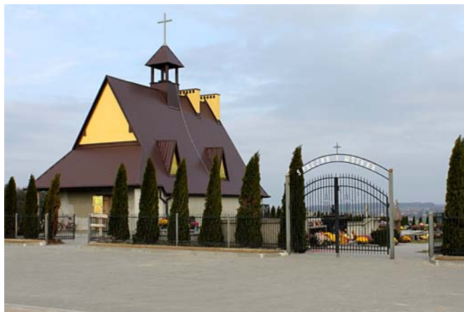
Kaplica cmentarna w Dobkowicach - w trakcie budowy.

Ponadto w bieżącym roku zakończono prace budowlane przy nowym oświetleniu ulicznym, na odcinku pomiędzy zabudową domów mieszkalnych a budowaną kaplicą cmentarną – wartość prac 45.000 zł.