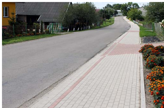
Nowy chodnik przy drodze powiatowej w Łowcach

W miejscowości Łowce w wyniku rozstrzygniętego przez Starostwo Powiatowe w Jarosławiu przetargu, wybudowano przy wsparciu finansowym Gminy Chłopice 856 mb chodnika. Chodnik usytuowany jest wzdłuż drogi powiatowej relacji Chłopice-Łowce-Radymno. Zadanie prowadzone jest przez Powiatowy Zarząd Dróg w Jarosławiu. Zgodnie z zawartym porozumieniem Gmina Chłopice wydatkuje na przedmiotowe zadanie 200 tys. zł.