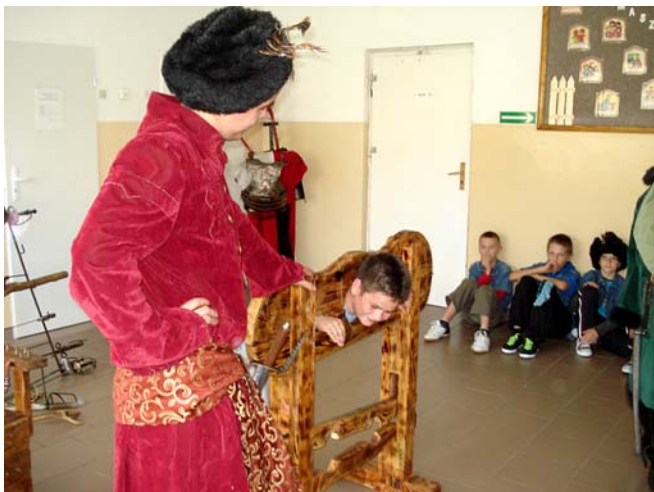
Żywa lekcja historii w Łowcach - występ grupy „Rekonstrukto”

Częstym gościem w naszej szkole jest również grupa teatralna, która przygotowuje spektakle o tematyce profilaktycznej. W tym roku aktorzy uświadamiali uczniów jakie zagrożenia czyhają, gdy nieodpowiednio korzystają z komputera i Internetu. W zeszłym roku artyści również nas odwiedzili, mówili wtedy o przemocy i problemach współczesnego świata.