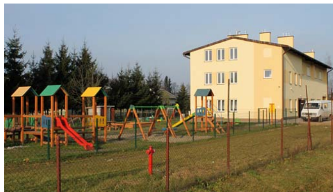
Plac zabaw przy świetlicy Wiejskiej w Jankowicach

świetlicy wiejskiej wiaty tanecznej (grzybka) której to wartość brutto wraz z dokumentacją wyniesie 78 tys. zł . Przy sprzyjających warunkach pogodowych przedsięwzięcie zostanie zrealizowane do końca bieżącego roku.