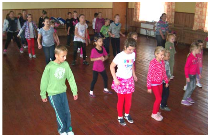
Zajęcia w Świetlicy w Chłopicach

Biblioteka organizując tego typu zajęcia stara się wychodzić naprzeciw potrzebom lokalnej społeczności oraz przełamać stereotyp, że biblioteka to tylko zbiór książek.