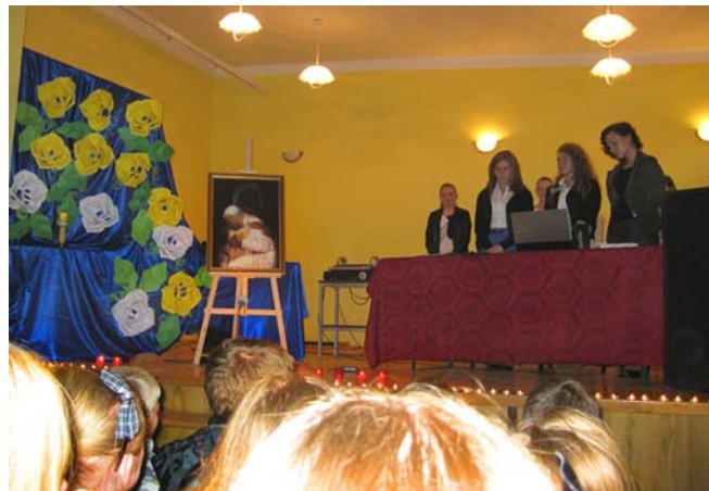
Występ młodzieży gimnazjalnej w Świetlicy wiejskiej w Boratynie

Od przyszłego półrocza w szkole będzie działać sala fitness. To kolejny pomysł na uatrakcyjnienie zajęć wychowania fizycznego i ograniczenie wyjazdów do sali sportowej w Chłopicach. Szkoła zakupiła już niezbędne wyposażenie tj. stopy, twistery, ławeczki, piłki itp. do ćwiczeń w układach tanecznych.