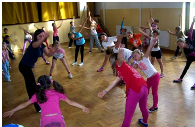
Zajęcia w Świetlicy w Łowcach