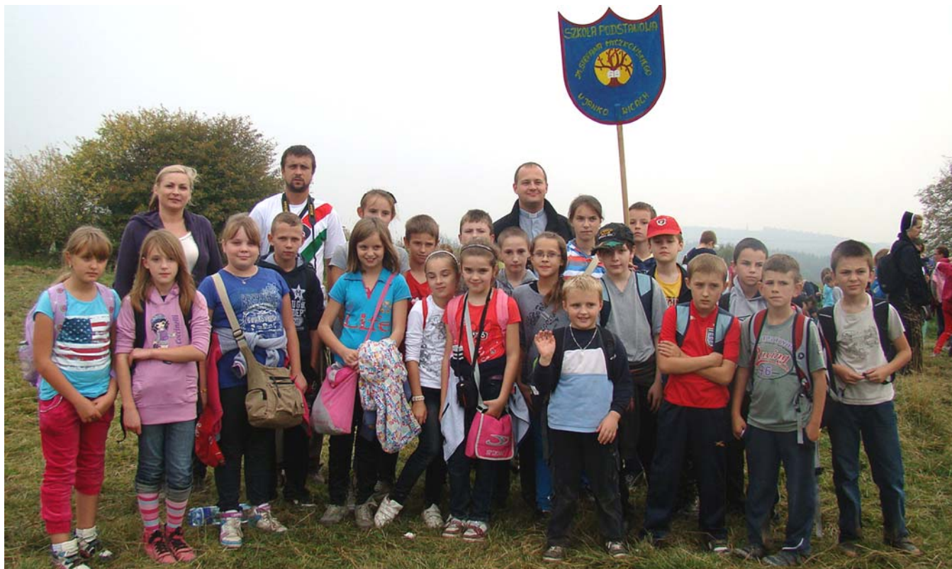
Uczniowie i opiekunowie podczas Rajdu