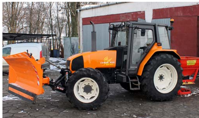
Ciągnik Renault CERES – zakupiony w listopadzie br. na potrzeby gospodarki komunalnej

Gmina Chłopice pozyskała bezpłatnie przyczepę samowyladowczą do ciągnika.