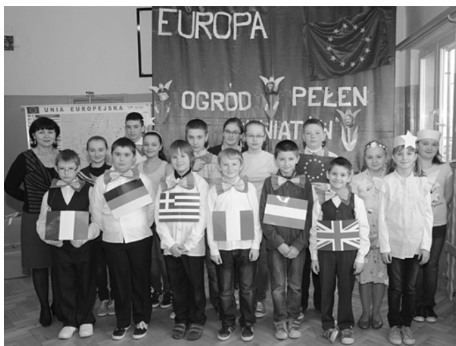
Członkowie Klubu Europejskiego