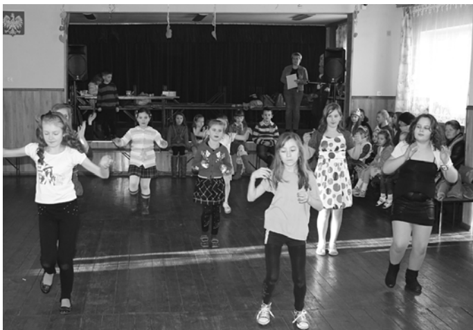
Występ taneczny rozpoczynający zabawę.

Zabawa karnawałowo-walentynkowa odbyła się 11 lutego o godz. 15.00 w Świetlicy Wiejskiej w Chłopicach. Było to wielkie karnawałowe szaleństwo. Dzieci brały udział w licznych konkursach z nagrodami i bawiły się przy dyskotekowych rytmach. Szaleństwu nie było końca... Na zabawie odbyło się rozstrzygnięcie konkursu plastycznego - „Plakat zachęcający do odwiedzin w bibliotece” oraz plebiscytu na najsympatyczniejszą dziewczynę i najsympatyczniejszego chłopaka. Zwycięzcy konkursu i plebiscytu otrzymali atrakcyjne nagrody rzeczowe i słodycze. Dzieci uczestniczące w cotygodniowych zajęciach w bibliotece przygotowały humorystyczną część artystyczną z okazji zbliżających się Walentynek.