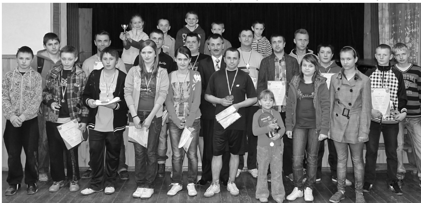
Uczestnicy turnieju tenisa stołowego o Puchar Wójta Gminy