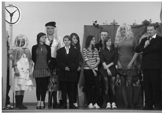
Młodzież wraz z Księdzem wikarym podczas występu artystycznego