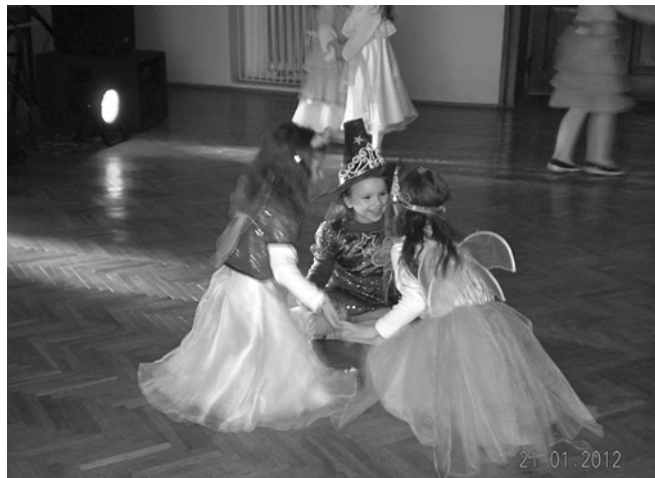
Karnawałowe szaleństwo na parkiecie w SP Chłopice