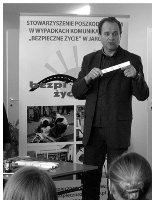
Spotkanie w Gimnazjum w Boratynie