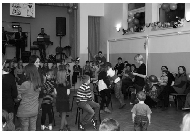
Łowce – zabawa karnawałowa