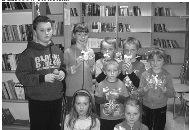
Dzieci wykonały własnoręcznie pisanki wielkanocne

Metody zajęć dostosowane są do wieku ich uczestników. W celu ich uatrakcyjnienia bibliotekarki prowadzące zajęcia wykorzystują różnorodne pomoce dydaktyczne oraz różne formy pracy z czytelnikiem. Biblioteka poprzez organizację tego typu zajęć odpowiada na potrzeby lokalnej społeczności oraz zachęca młode pokolenie do częstego odwiedzania i korzystania z zasobów biblioteki.