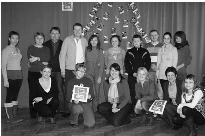
Podczas dni finałowych „Szlachetnej Paczki” w Jankowicach