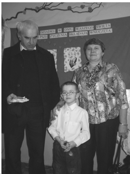
SP Chłopice -Dziadkowie z ze swoim ukochanym wnuczkem..