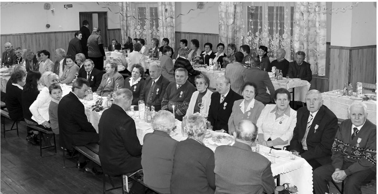
Na zdjęciu górnym uroczystość w Chłopicach, na dolnym – w Łowcach